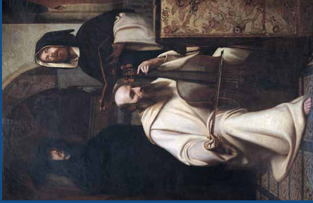
Francisco Laso El canto llano (El concierto) Ca. 1855-1856 Colección Pinacoteca Municipal Ignacio Merino